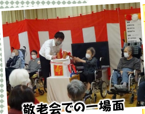
敬老会での一場面

趣味の作品合同展出品を目指して ちぎり絵4作品を制作しました。 チームワークの良さは抜群、 色彩センスも抜群、 集中力も大したものでした。