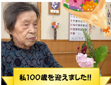
私100歳を迎えました!!